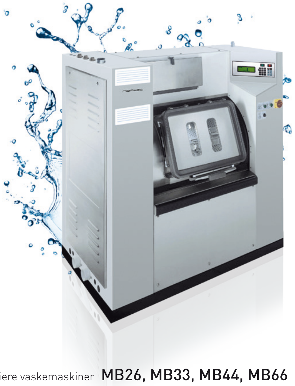
Barriere vaskemaskiner MB26, MB33, MB44, MB66