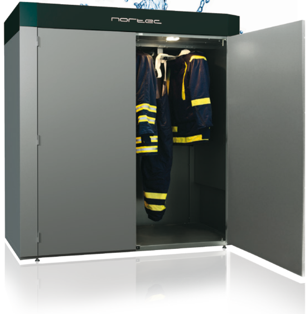
Tørreskab FC 20