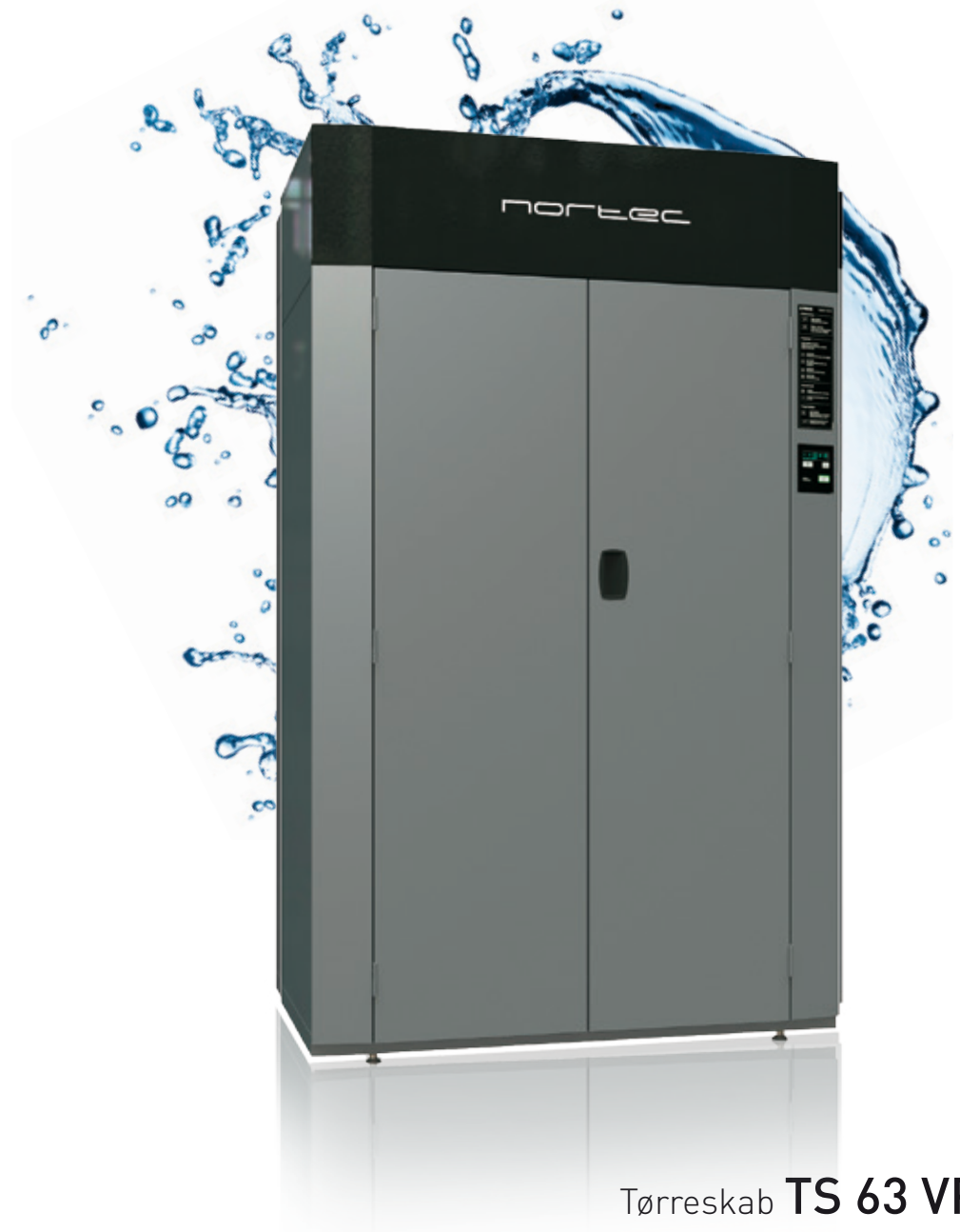
Tørreskab TS 63 VP